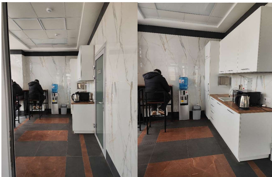
Комната приема пищи для работников Центра точного земледелия СХП «Мазоловогаз» УП «Витебскоблгаз» в д. Буяны