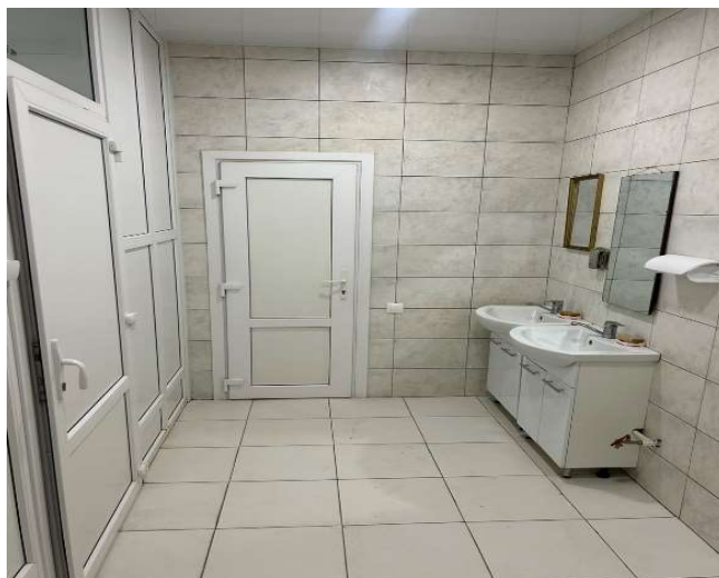
Комната приема пищи, душевые для работников ОАО «Витебский облгросервис»